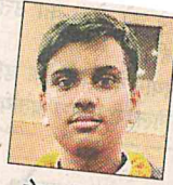
तेजस सवसेना 96%, सीएमएस गोमती नगर कैंपस-1